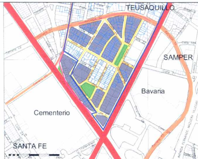
Inmuebles de Interés Cultural - MORFOLOGÍA EN PLANTA