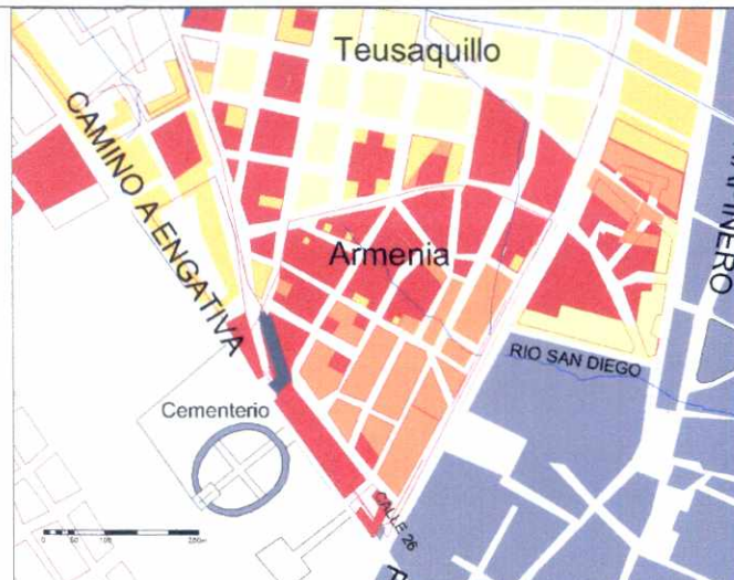
CRECIMIENTO HISTÓRICO - CRONOLOGÍA