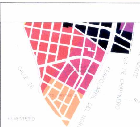
PLANO DE URBANIZACIONES

En el barrio Armenia la arquitectura encierra su espacialidad. Las manzanas de edificios sobre la calle 26 y la avenida Caracas, parecen querer establecer una muralla de protección, mientras que el otro costado, al norte, se abre con viviendas de dos pisos.